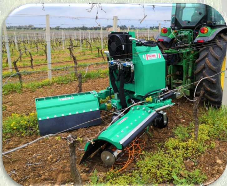
Stabilità garantita dal sistema a 3 ruote

Impianto idraulico indipendente per il funzionamento del motore rotore. I comandi della traslazione e inclinazione della testata sono azionati tramite innesti rapidi collegati ai distributori ausiliari del trattore