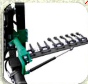
Barra orizzontale inferiore con inclinazione idraulica