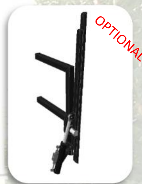
Porta barre verticale girevole