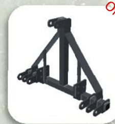
Attacco sollevatore 3 punti