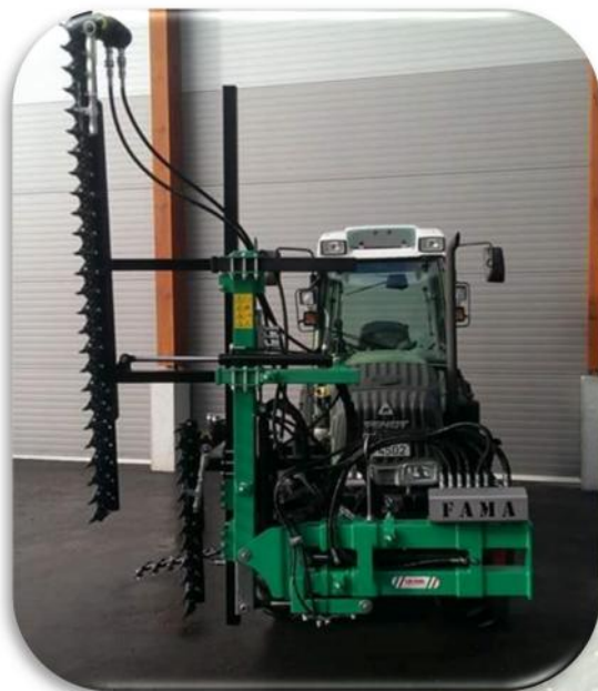
CKP2BV. Cimatrice a 2 piani di taglio verticale (2 + 1 Mt.)