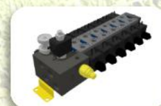
Distributore 5/7 movimenti