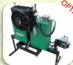
Impianto Idraulico Pompa 26L.