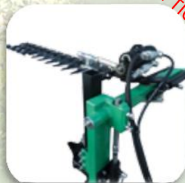
Barra orizzontale superiore con rientro e inclinazione idraulica