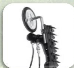
Ruotino salva reti