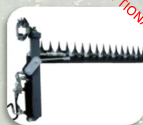
Barra orizzontale per topping con inclinazione meccanica e rientro idraulico

Apparato di taglio a finestre SISTEMA BREVETTATO