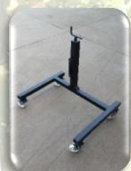
Cavalletto di sostegno regolabile in altezza