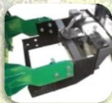
Flangia universale con 2 posizioni d'attacco