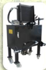
Impianto idraulico per trattori reversibili Pompa 26L.